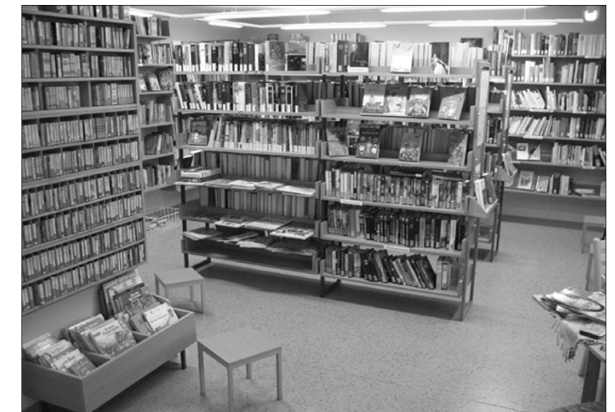
Innenraum der Bücherei in Flieden.