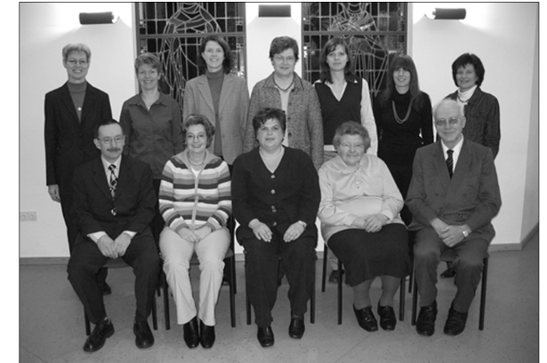
Jubiläumsfoto „100 Jahre Bücherei“.